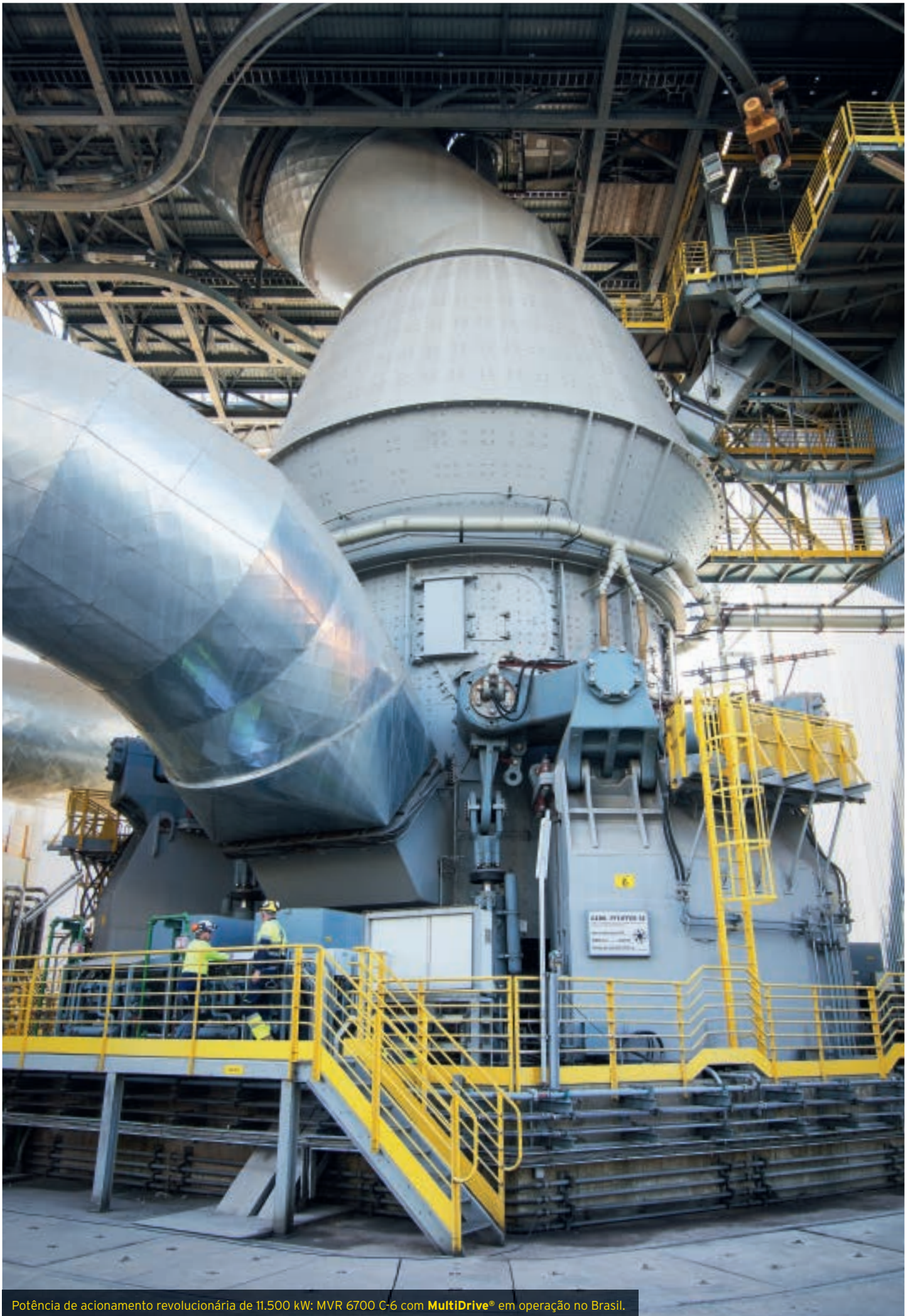
Potência de acionamento revolucionária de 11.500 kW: MVR 6700 C-6 com MultiDrive® em operação no Brasil.